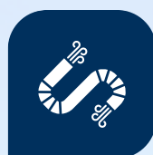
Гибкие и отсасывающие трубы

Подробную информацию Вы найдете на нашей веб-странице: www.cft-gmbh.de . Или просто позвоните нам, мы с удовольствием лично ответим на Ваши вопросы и более подробно расскажем Вам о новых струйных вентиляторах CFT Tunnel Jet Fans и вентиляторах для дымоудаления CFT Smoke Extraction Fans